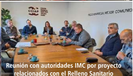
Reunión con autoridades IMC por proyecto relacionados con el Relleno Sanitario