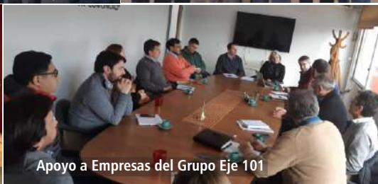
Apoyo a Empresas del Grupo Eje 101