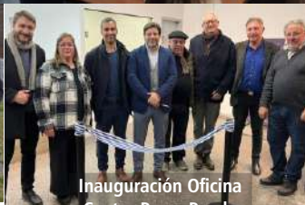
Inauguración Oficina Centro Pyme Pando