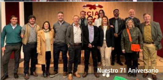
Nuestro 71 Aniversario