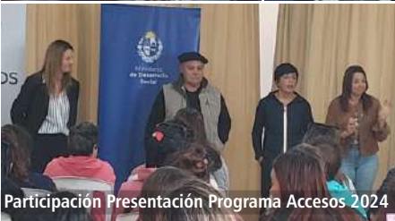
Participación Presentación Programa Accesos 2024