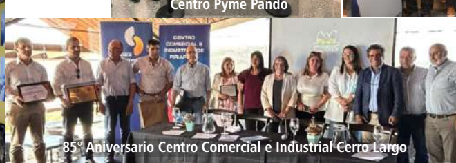
85º Aniversario Centro Comercial e Industrial Cerro Largo