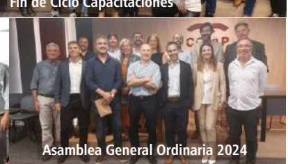
Asamblea General Ordinaria 2024