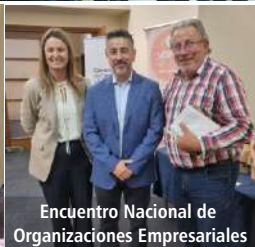
Encuentro Nacional de Organizaciones Empresariales