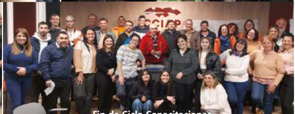
Fin de Ciclo Capacitaciones