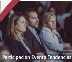
Participación Evento Tendencias