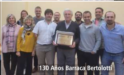
130 Años Barraca Bertolotti