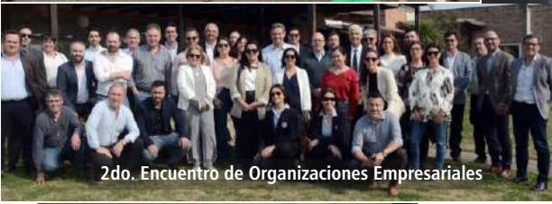
2do. Encuentro de Organizaciones Empresariales