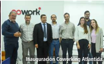
Inauguración Coworking Atlántida