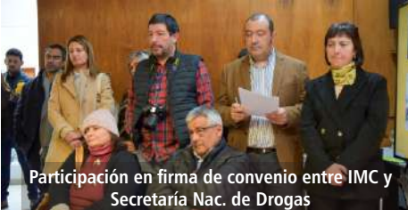
Participación en firma de convenio entre IMC y Secretaría Nac. de Drogas